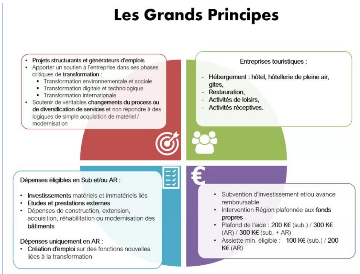
Figure 2. Les grands principes régissant l'accompagnement du secteur touristique par la Région Occitanie. (Source : présentation de Emmanuelle FOUQUET, 2024).