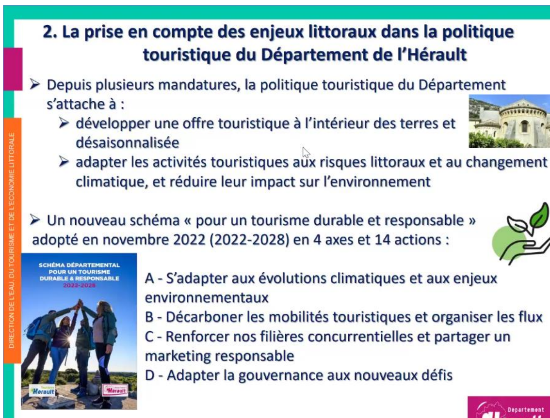
Figure 3. La politique touristique de l'Hérault, une politique intégrée dirigée vers la prise en compte des changements climatiques