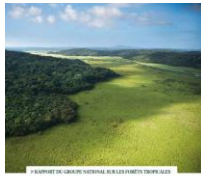
Forêts tropicales : point d'étape et nouveaux défis QUELLES ORIENTATIONS POUR LES ACTEURS FRANÇAIS ?

Le ministère des Affaires étrangères, le ministère de l'Ecologie, du développement durable et de l'énergie, le ministère de l'Agriculture et de l'agroalimentaire et le ministère des Outre-mer viennent d'annoncer la sortie du rapport « Forêts tropicales : point d'étape et nouveaux défis ». A l'occasion d'une journée consacrée aux forêts à la conférence des Nations Unies sur le développement durable (Rio+20), le Groupe national sur les forêts tropicales (GNFT) a présenté le 17 juin dernier à Rio un rapport qui vise à faire le point sur les enjeux forestiers tropicaux et à définir de nouvelles orientations face aux défis émergents dans les bassins forestiers tropicaux. Ce groupe est un organe consultatif informel créé en 2002 et visant à discuter de la doctrine et des orientations françaises sur les forêts