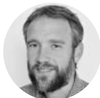
Alexandre DELAMARRE BIOTOPE Biodiversité