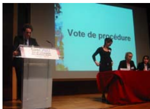
A la tribune, et à droite : la Présidente, la Secrétaire générale et le Secrétariat.

L'École de management Euromed Marseille a co-organisé avec l'UNRIC une simulation ONU Modèle à laquelle ont participé 166 élèves de classes préparatoires françaises et 67 étudiants d'Euromed, sur les thèmes « plans d'action pour réguler les flux migratoires » et « croissance économique et développement durable ». Un forum ONG a regroupé quelque 20 organisations et associations pour cet événement (UNICEF, ONUDI, WWF, Greenpeace...)