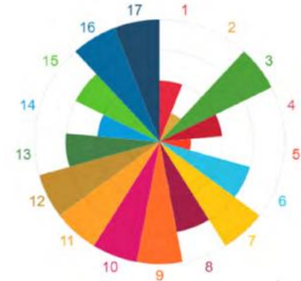
Visualisation de la contribution d'un projet de territoire aux ODD avec le RFSC

En quoi les ODD ne rendent-ils pas plus complexe le pilotage des politiques publiques ? Existe-t-il des outils pour aider les acteurs à s'approprier les ODD ?