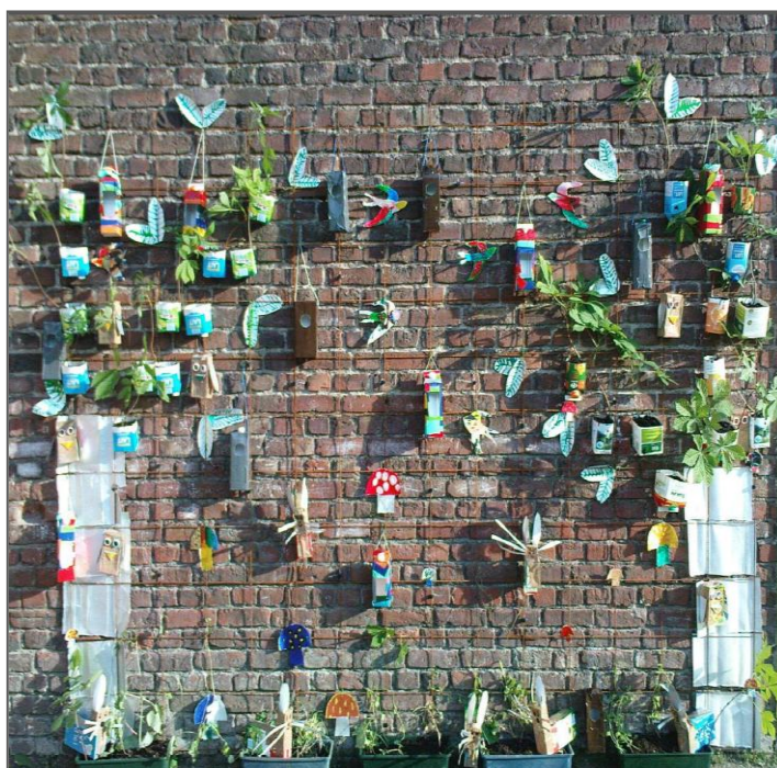
Coup de cœur du jury EcoleNature dans le cadre du concours de l'édition 2010-2011 : « Le Mur végétal » de l'école Saint Bernard de Cambrai (59)