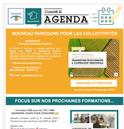
Agenda du Mois Grand Ouest

Le Comité 21 envoie tous les mois une newsletter regroupant les informations les plus significatives sur le développement durable (réglementation, bonnes pratiques, publications, enquêtes/sondages, appels à projets...). Des "alertes" sont également envoyées de façon ciblée.