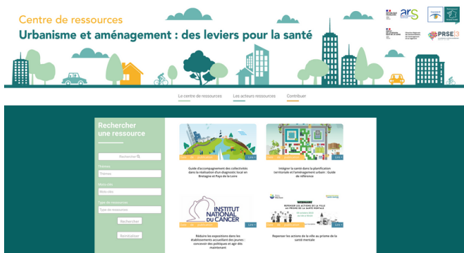
Site internet UFS - Novembre 2023

Le Comité 21 met à disposition de ses adhérents un centre de ressources, regroupant des milliers de documents sur la Responsabilité Sociétale des Entreprises (RSE), les Objectifs de Développement Durable (ODD), l'adaptation aux changements climatiques, la mobilité durable, la transition énergétique, l'économie circulaire, la santé environnementale ou encore la citoyenneté écologique. Ces documents sont consultables en ligne.