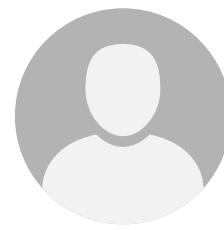
Directeur.rice Climat En cours de recrutement